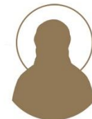
Мученик Георгій Юривъ

1887–1937 Место рождения: г. Витебск День памяти: 20 ноября