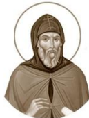
Преподобномученик Фанасий, игумен Брестский ок. 1595–1648

Место рождения: неизвестно День памяти: 2 августа, 18 сентября