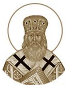
Священномученик Нона (Лазарев), епископ Бялыжский, викарий Полоцкой епархии 1869–1937

Место рождения: с. Луцко, Тихвинский уезд День памяти: 21 октября