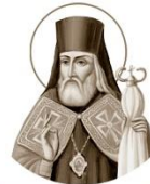
Святитель Меастий, архиепископ Харьковский и Ахтырский 1784–1840

Место рождения: с. Старые Саюжары, Российская империя День памяти: 29 [28 в невисокосный год] февраля