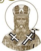
Святитель Дионисий, епископ Полоцкий ?-1183