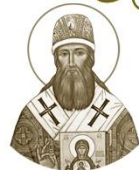
Святитель Гавриил (Городков), архиепископ Рязанский 1785–1862

Место рождения: с. Городкови, Спасский уезд День памяти: 20 апреля