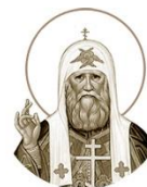
Святитель Тихон (Бваабин), Патриарх Московский и всея России, исповедник 1865–1925

Место рождения: пос. Клин, Горюновский уезд День памяти: 22 февраля, 7 апреля, 9 октября, 18 ноября