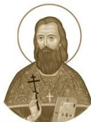
Священномученик Константин Жданов, пресвитер Шарковщинский

1875–1919 Место рождения: м. Старо-Шарковщина, Дисненский уезд День памяти: 29 августа