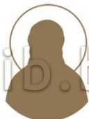
Священномученик Иннокентий (Асташев), архиепископ Харьковский 1881–1937

Место рождения: г. Бийск, Российская империя