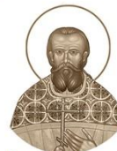
Священномученик Илья (Рыльковъ)

1881–1937 Место рождения: м. Ридовля, Топольский уезд День памяти: 21 ноября