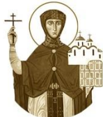
Благочестивая Всеволодья Псковская

ок. 1200–1243 Место рождения: г. Полоцк День памяти: 29 октября