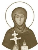
Преподобная Евфросиния, игумения Полоцкая

ок. 1104–1173 Место рождения: г. Полоцк День памяти: 5 июля