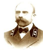
Священноисповедник Басилій Малазовъ

1873–1937 Место рождения: д. Дуброво, Городецкий уезд День памяти: 24 марта