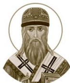
Святитель Сима, епископ Полоцкий

ок. 1050–1116 Место рождения: г. Полоцк (Р) День памяти: 3 июля