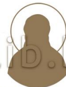
Священномученик Федор (Тонкобен), пресвитер Ловецкий

1885–1942 Место рождения: д. Зобаль, Полоцкий уезд День памяти: 7 августа