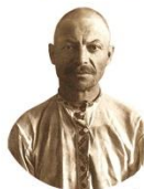
Мученик Дмитрий Блазыковъ

1880–1942 Место рождения: м. Россая, Горельский уезд День памяти: 5 мая