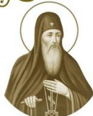
Преподобный Арсенъ Затеверникъ

† – ок. 1190 Место рождения: г. Полоцк День памяти: 6 ноября