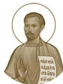
Исповедник Витзебский Владимир Вазневский 1874–1954

Место рождения: с. Прокоп, Великий уезд День памяти: 8 апреля