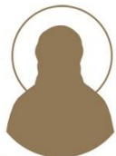
Преподобномученик Димитрий Лазаревъ

1884–1969 Место рождения: с. Гришаны, Оршанский уезд