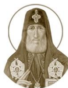
Священномученик Кирион III (II) Садзагалшвили 1855–1918

Место рождения: с. Квемо-Никозди, Горийский уезд День памяти: 27 июня