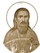
Священномученик Николай Оболобичъ

1863–1934 Место рождения: д. Ухлятино, Витебский уезд День памяти: 12 сентября