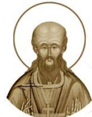
Священномученик Михаил Оболобичъ

1888–1938 Место рождения: г. Полоцк День памяти: 26 марта