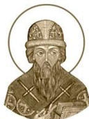
Святитель Сима, епископ Полоцкий

ок. 1230–1289 Место рождения: г. Полоцк День памяти: 16 февраля