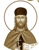
Священномученик Владимир Пичуляни

1889–1938 Место рождения: г. Витебск (Р) День памяти: 10 февраля