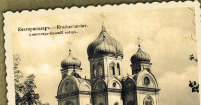
Екатериноград... — Екатериноград. Александровский собор.